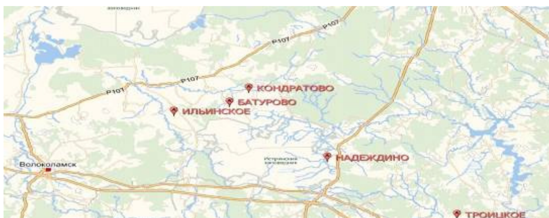
Населённые пункты занятые бригадой в декабре 1941 года

Продолжая с боями продвигаться вперед в направлении на Волоколамск, бригада заняла населенные пункты Субботино, Козино, Головково, Мартыново и Шапкино. За первую половину декабря она освободила от фашистских оккупантов 25 населенных пунктов, уничтожила свыше двух вражеских полков и захватила трофеи. В ходе победоносных боев бригада понесла значительные потери. Со 2. 12 по 17. 12 она потеряла убитыми и ранеными 1648 человек, т.е. 36 процентов своего состава. 15-24 декабря, продолжая наступление, части бригады с боями заняли населенные пункты Филатово, Батурово, Воротов, Кондратово, Ильинское Кузьево и вышли на укрепленный оборонительный рубеж реки Лама.