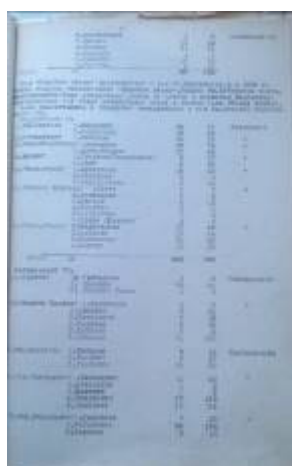
Лист из книги с указанием сельского Совета